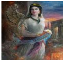
بانو کتایون همسر گشتاسپ شاه بلخ = ایران

به هر روی، در فرهنگ ملی و تاریخی کشور ما قبل از اسلام، زن آزاده بود و مانند مردان در بزم و رزم بر سریر زندگی تکیه میزد. کارفرما و رزم آراء، و شاه دل آراء بود. اکنون چند روایت تصویری از زنان پیش از اسلام و بعد از اسلام را به قضاوت می نشنیم