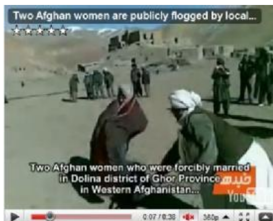
عکس شماره ۳

یکی از دختران است که خواسته از بند شیاد فرار نماید. اما لشکر ابلیس دستگیرش می نمایند و به دستور شیطان در کوچه به جرم فرار از حصار اهریمن شلاق زده می شود. بدون شک این دختر و هزاران هزار دختر دیگر سرزمین ما فهم و دانش آرمیس شدن را دارند و میتوانند در تمام عرصه های علم و دانش درفش ناخدایی را بر ستیغ زندگی بر افرازند، در صورتیکه رها از زندان شیادان باشند و آزاد از تفکر اهریمن.