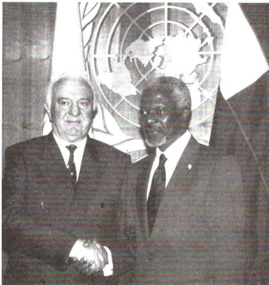
رئیس جمهور گرجستان ادوارد شواردنادزه و دبیرکل سازمان ملل کوفی عنان.