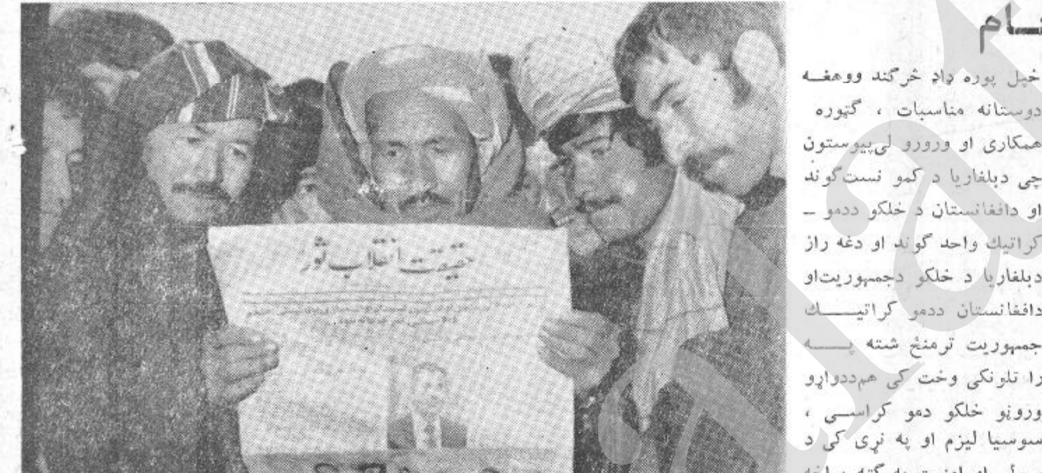
خبرنگر چی د «حقیقت انقلاب شور» ورځپاڼه په رښتینی توگه د خلکو د غوښتنو منعکس کونکی ده نو د خلکو د زیاتی مینی له کبله یی د هیواد د مطبوعاتو په تاریخ کی د تیراژ ریکارډ مات کړی .

منشی د انقلابی شورا درنيس او صدراعظم بېرک کارمل تاریخی او زغورنده ویناوې او د گوند دمر کزی کمیته له افغان نستان د دمو کراتیک جمهوریت د دولت د انقلابی شورا او حکومت ملی، تاریخی اعلامی او ابلاغی د انقلابی شورا درنيسه هیات درنيس او غړیو او د حکومت دغیو عکسونه خپاره کړی دی . دغه راز ددغو ورځپاڼو نور محتویات سرمقالی، خبرونه او د سیاسی بندیانو دخوشی کیدو په باب مصور راپورتاژ