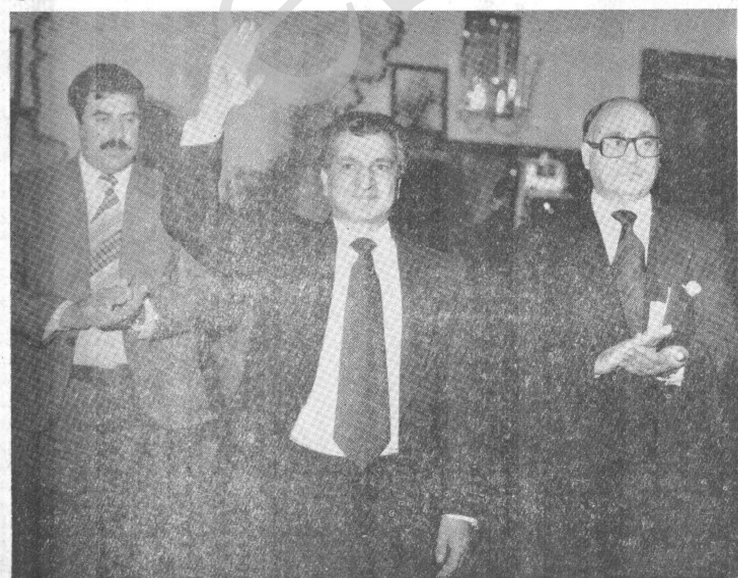
بیرک کارمل منشی عمومی کمیته مرکزی حزب واحد دموکراتیک خلق افغانستان ، رئیس شورای انقلابی و صدر اعظم جمهوری دموکراتیک افغانستان و معاونین شورای انقلابی و صدر اعظم در جلسه مشترک اعضای کمیته مرکزی ج.خ.ا. شورای انقلابی، اعضای حکومت و عده ای از فعالین حزبی

کابل - دافغان نستان د حالاتو په باب پروادا وڅیړی . یوه مقاله څیره کړی او دهغی په ترڅ کی یی ویلی دی چی : ۱۹۷۸ کال دانتلاب نه وروسته د امریکا د متحدو ایالاتو او چین په مرسته دکورنی او بهرنی تجاعی قواوو دافغانستان ددموکراتیک جمهوریت په چارو باندی وسله وال تیری ترلاس لاندی ونیوه . دپاکستان په خاوره کی دامریکا د متحدو ایالاتو ، چین اومصر د جاسوسی شبکو د عمالو په مرسته دشور شیانو ډلی تر روزنی لاندی نیول کیږی چی وروسته افغانسته ن ته لیږل کیږی . دافغان نستان حکومت څو څوځای له شوروی اتحاد څخه دپوځی مرستی غوښتنه کړی وه که چی دافغانستان په چارو کی لاس وهنی خطرناکه بڼه غوره کړه نو دهغه هیواد حکومت بیا هم دغه مرسته وغوښتله اردغه مرسته ومنل شوه . پروادا لیکي د عسکرو یوه محدود ډله افغان نستان ته لیږل شوی چی هغه به پوځی د بهرنی وسله والی لاسوهنی (ص۷)