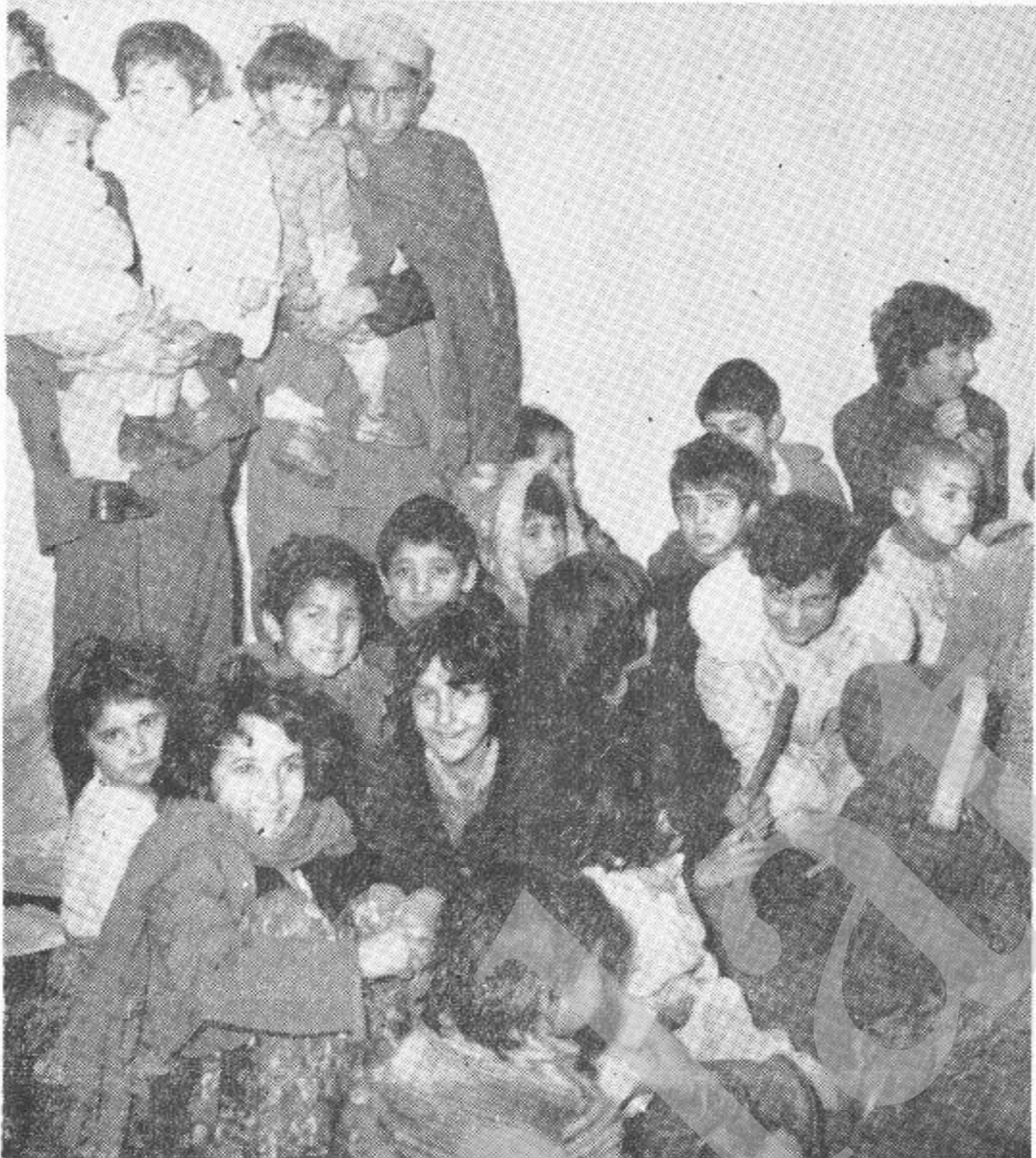
دامین فاشیستی ملی دموکراتیکو حقوقو آوازی د تانمن پہ بارہ کی دتولو ادعاگانو سرہ دیگنہ ما شو مانو بندیا نولو خخہ ہم دہونکرہ. دامیلہ خای یا کورندی بلکی دیندی ما شو مانو کوچی ولدہ چی د آزادی دغہ پہ اوریدلو سرہ یی پہ خو لہ کی دخندا غویی، سپرل شویلی.

مأمول شونہ. شام روز ۶ جدی ہنگامیکہ از امواج رادیو افغانیستان خیر سقوط زما مداری باندامین را استماع کردم مژدہ رہایی زندانی های سیاسی را شنیدیم برق خوشی و سرور از چشمانم سا طع گردیدو بسہ اطمینان و امید واری کا مل، مژدہ آمدن شوہرم و پسند فرزندمان را بہ اطفال دادہ وتا صبح نخواستیم واز ہنگام طلوع آفتاب دست فرزندمانرا گرفته را ہی این محل شلم تا در اطراف رہایی زندانیان سیاسی خیرہایی خوش بشنوم ودر صورت لزوم از شوہر زندانی خود در صورت تیکہ از زندان رہا شدہ با شد