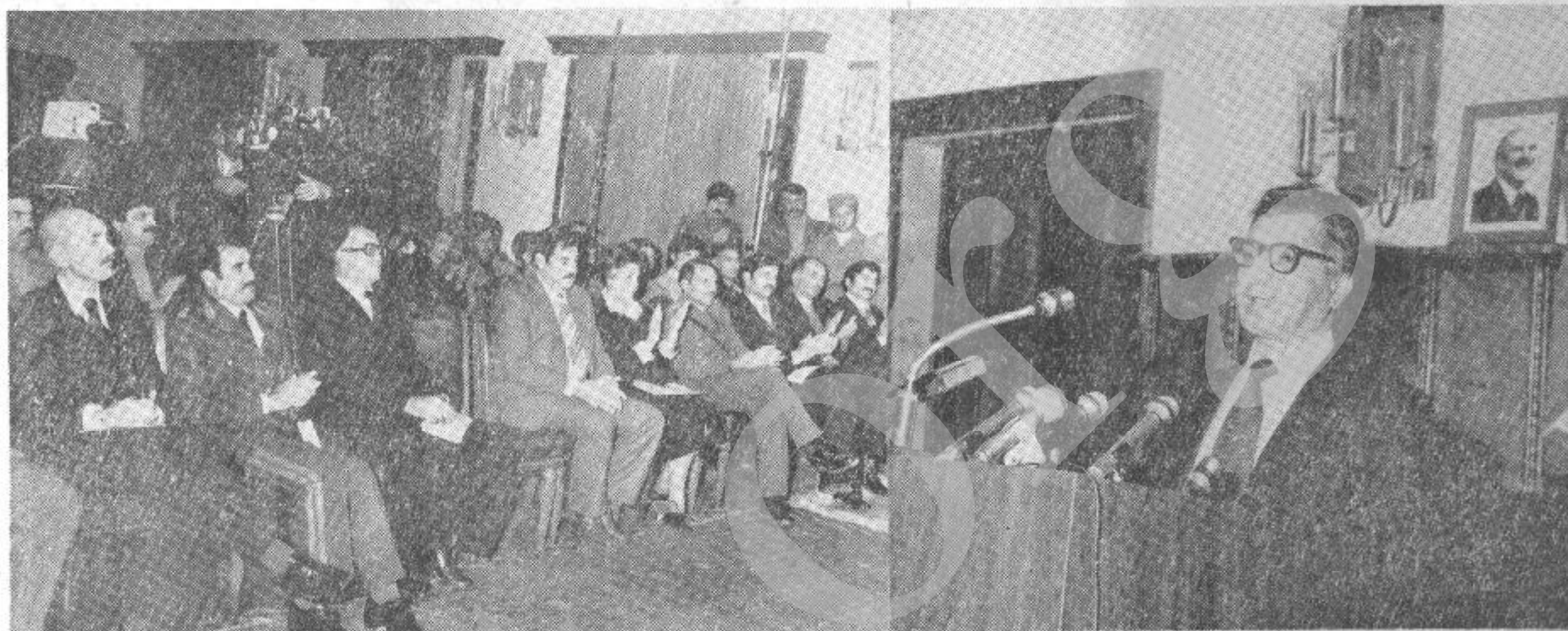
بیرک کارمل منشی عمومی کمیته مرکزی حزب دموکراتیک خلق افغانستان، رئیس شورای انقلابی و صدر اعظم جمهوری دموکراتیک افغانستان هنگام ایراد باینامیه مراسم پانزدهمین سالگرد تاسیس حزب دموکراتیک خلق افغانستان.

کابل : پانزدهمین سالگرد بعد از ظهر دیروز طی جلسه تاسیس حزب واحد پر افتخار مشترک کمیته مرکزی حزب دموکراتیک خلق افغانستان واحد دموکراتیک خلق افغا - ستان و هیات رتبه شورای انقلابی، اعضای حکومت و بعضی از فعالین حزبی در طی این جلسه بېرک کارمل