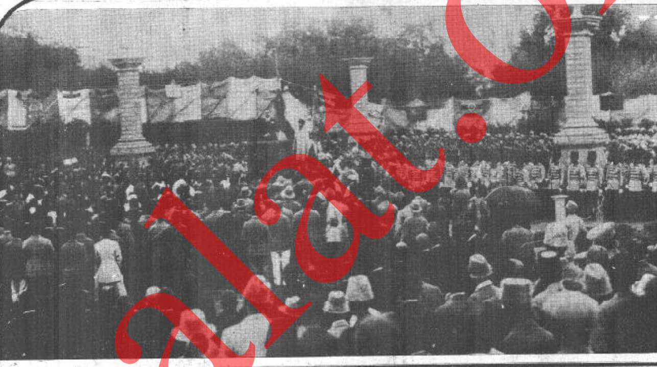
دوستانم از آنجا افغانستان مستقل در کنار امام الله غازی اولین سالگرد استقلال کشور را با دلپایان هیجان زده پرهیز ، تعطیل می‌نمایند. استقلال ما شرف ما است . بگذار این صحنه ما برای همیشه در قلب ما و در ذهن ما بماند . و کسی دشمنان ما امروز می خواهد اند از بی مردم ، ما را که از برکت پیروزی انقلاب ملی و دزد گرا تیک تور و بلصوس مرحله نوین تکاملی آن به دست آورده است . در زیر پرچم های خشن خون آورد خود با حال سلازم . ما قادر هستیم با تکیه نیروی شکست ناپذیر مردم تحت رهبری حزب شیطان و فرماندهان دشمنان داخلی را در هم شکستیم . ما نمی گذاریم تجربه تلخ شکست امام الله خان بیکار دیگر تکرار گردد . ارتجاع منطقه ، جزو نیست های بیخبرم بکن و امپریالیسم و سواپ آمریکا نگویند . ترانس استقلال و آزادی کشور ما را پامال نمایند . همه نیرو های انقلابی جهان و مخصوصاً اتحاد شوروی بزرگ در نبرد مقدس مردم ما بظافر دفاع از استقلال و حاکمیت ملی و تمامیت ارضی کشور و دست آورد های انقلابی مردم ما بیا بباری رسانند .