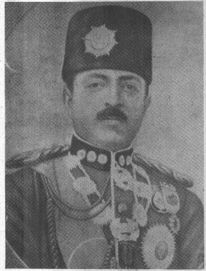
دردیاری که ایران الله غازی این سر داری نبرد آزادی بخش مردم ما در بارگاه تاریخ ما جای شایسته ای دارد.

امان الله غازی که زاده خانواده سلطنتی بود پسر و نوه مردم ما نزدیک شد. او توانست از توده های عظیم رنجیده مردم ما نمایندگی کند. امان الله این فرزند خلف جنبش مشروطیت و نهضت فیر سادانه آزادی خواهی، تابه آخر به آرمانهای اصلاح طلبانه خویش در جهت شکوفایی وطن وفیاد باقی ماند.