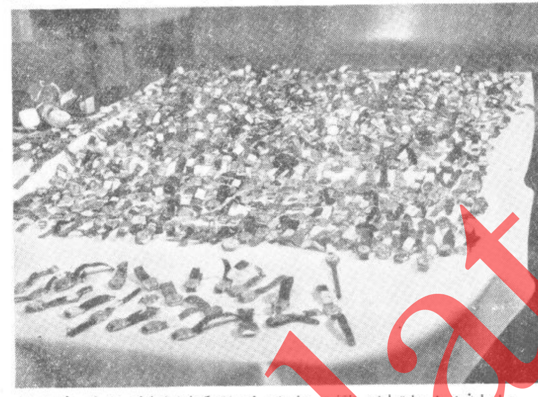
صاحبان این ساعتها این انگشتر ها و این زیورات کجا بیند؟ شاید در زیر خروار ها خاک بایکدنیا آرزوی بسمیر نرسیده خفته اند. ما یاد شانرا گرامی میداریم و فاتلان بیشرم آنها را نخواهیم بخشید.

د هیواد له تا موس خپه په دفاع کی بی دیکتیا ولایت دشریفو خلکو لایو مو تسی کیدل او بیو ستون وغوښت. په مقابل کی دگردیز دنیار خو تنو مشرانو او سپین پیرو دخپلو قومو نو په نمایندگی دثور انقلاب دپشپړ تیا دنوی پروا په رڼا کی دپاکې خاوری او انقلاب دنیکیو ددفاع لپاره خپل هر ډول تیاری وښود.