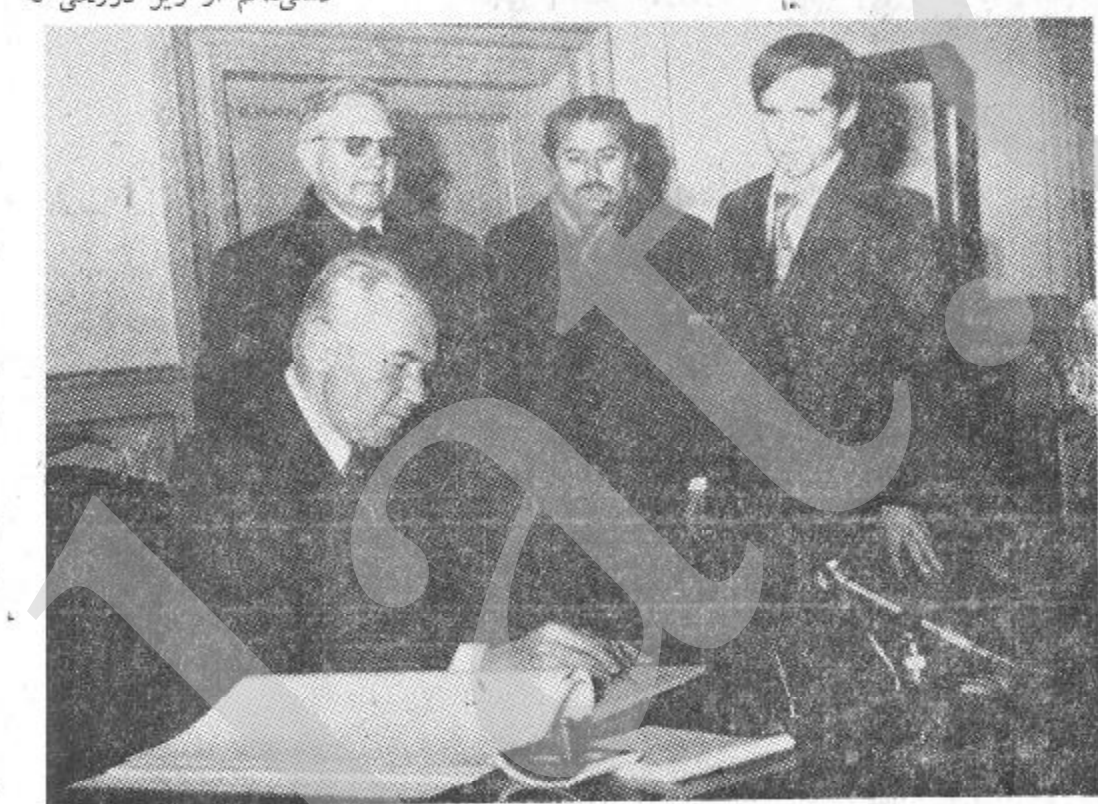
سفیر کبیر اتحاد شوروی مقیم کابل هنگامی که مراتب همدردی وتسلیمت خود را در کتاب مخصوص درج مینماید.

دمرکزی کمیته دسیاسی بیرو غیری او د ښوونسی او روزنی وزیري ډاکتری اناهیتا راتب زاد دمرکزی کمیته دسیاسی بیرو حکومت او انقلابی شورا په نمایندگی د ښخو دفاتحی په مراسمو کی برخه واخیسته او د گوند دملی ماتم او ویر دورخی له