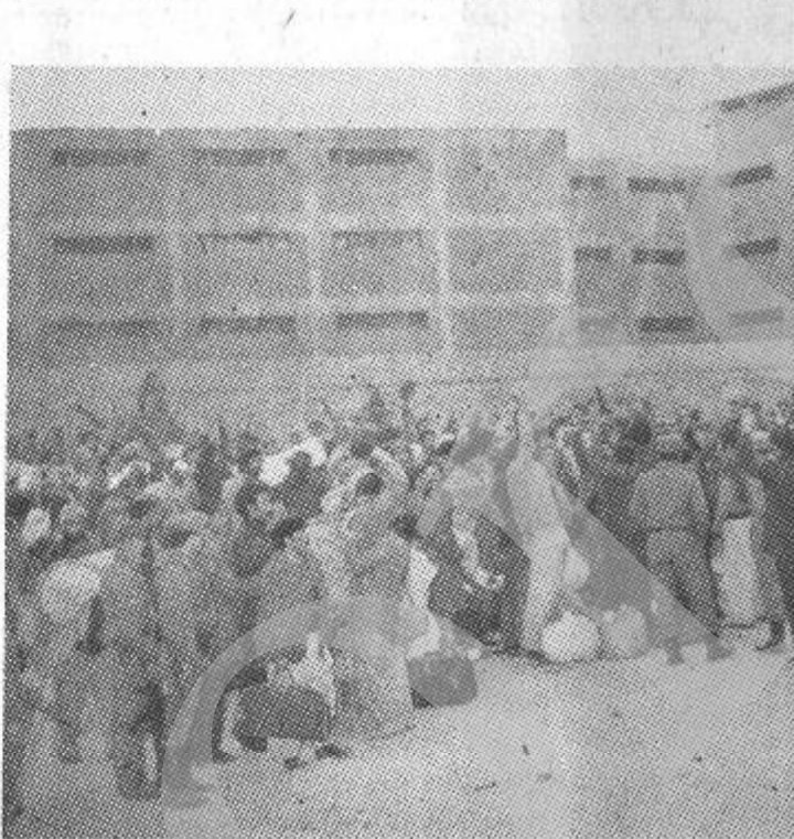
تصویری از هو طنسان آزاد شده ما از زندان نظامی شیمیست امین .

خالی است که عواطف ما را به سوی خود میکشاند و جز اینکه درود آتشین به ارواح پاک شان بفرستیم و خوشتر نهایت غمگین و متاثر بیقیم دیگو کاری نمیتوان کرد . ما به چنین فامیلیاییکه فرزندان دلیر و پاشامتی در دامان مقدس خود پرورانیده اند تسلیم عرض کرده و میسپرداریم به نشر مصاحبه هاییکه یکروز قبل از آزا دی زندانیان سیاسی با ایشان در داخل بلاك های باستیل