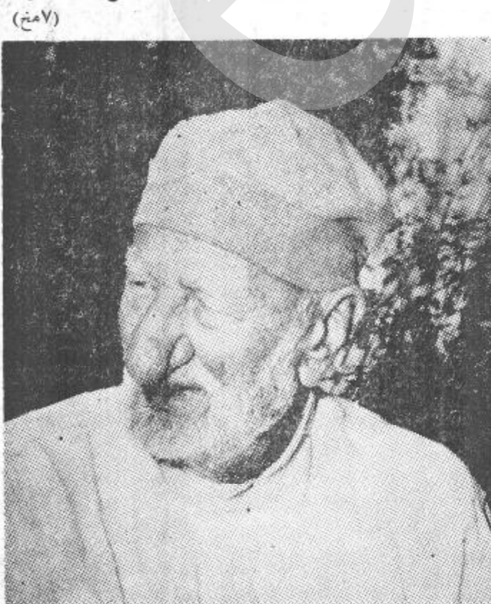
د پښتنوله نامتو مشر خان عبدالغفار خان

د پښتنو نامتو مشر خان عبدالغفار خان چې د لوی هندو لوی پښتونخوا د آزادۍ غوښتنی غورځنګ یو بیاوړی مبارز دی او دخپل دونوی کلن عمر زیا ته برخه یې په دغه لار کې تیره کړې ډیری لوړې ژورې او تودې سرې شاته پری ایښي او لا تر اوسه د «علم تشهد» سوله ییزه مبارزه پر مخ بیایي ، د شور د ملي او دموکراتیک انقلاب د نوي ژغورنده پړاو په باب زموږ د خبريال په ګډون د زارديو تلویزیون او با ختر آژانس له استازيو سره یوه مرکه کړې چې دادی ګرانو لوستونکو ته وړاندې کړي . باید وویل شي چې د هر بوطه معا لچ دو کتور د