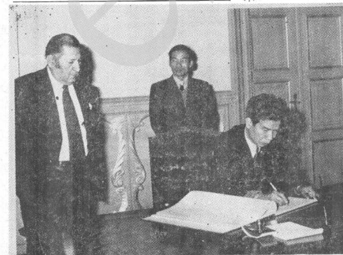
سفیر کبیر جمهوری سوسیالیستی ویتنام موقع که مراتب همدردی وتسلیمت خود را به مناسبت روز ماتم ملی در کتاب مخصوص درج می نماید .

توزیع وشکایات : ۳۶۸۵۹ قیمت يك شماره ۲ افغانی دولتی مطبعه