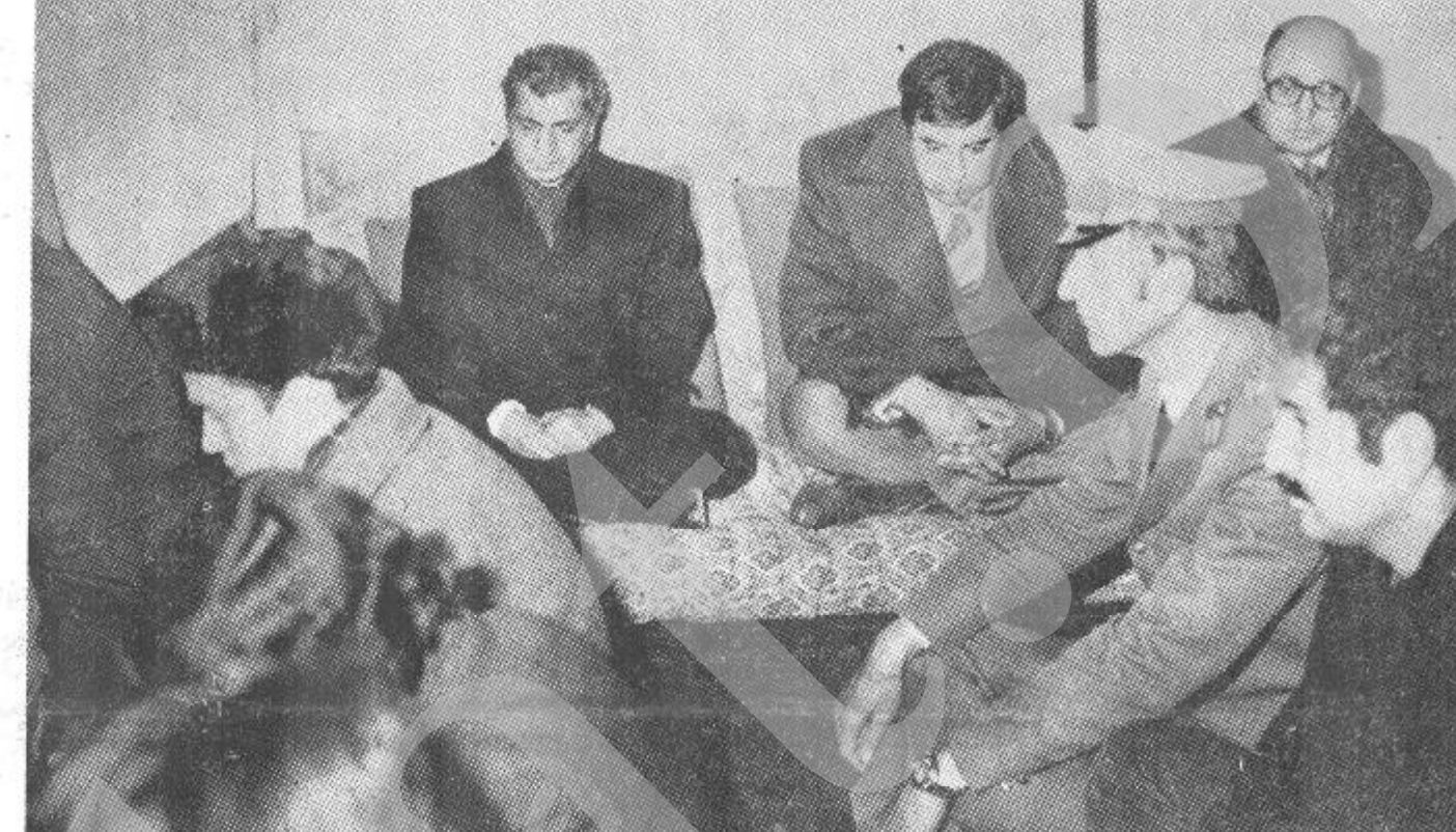
ببرک کارمل منشي عومي حزب د دموکراتیک خلق افغانستان رئیس شورای انقلابی و صدر اعظم به همراهی اسدالله سروری وسلطانی کشتند. معاونین شورای انقلابی و صدراعظم در مراسم سوگوارى وفاتجې خوانی روز عزای ملی در مسجد جامع مقر شورای انقلابی اشتراک نمودند.

پرون یکشنبې د جدې په ۲۳ نیټه چې د افغانستان د دموکراتیک جمهوریت دولت له اعلامیې سره سم د شریفو روحانیونو، کادرانو، رو شنفکرانو، بزگرانو، کسب گرو زیار ایستونکو ځوانانو انجینرانو، لیکوالو، پوهانو او له دغې جملې څخه د افغانستان د خلکو د دموکراتیک ګوند څه د پاسه زرو تنو غړیو په ګډون زموږ د زرګونو بی گناه شهیدو وطنوالو د روح د یادونې او نمانځنې دپاره چې د جلا د وینې ځینونکی امین دیانده په لاس شهیدانو شوي د ملي ماتم ورځ ټاکل شوي او په ټول هیواد کې عمومي رخصتې وه دکابل ښار او د هیواد د ولایتو دمرکزونو په جامع جوماتونو ښاري سالونونو کې فاتحې واخیستلې شوي او د ماتم او غم مراسم پر ځای شول او د گران هیواد په سلګونو زرو زیار ایستونکو رنځیدلو، کړیدلو ځوریدلو ځلکو د سهار له اتو بجو څخه دغرمې تر دولسو