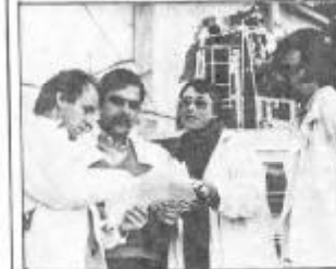
کیهان نوردهان اتحاد شوروی و یانایا و یانایا که در سال ۱۹۸۱ برای نخستین بار پرواز کیهان مشترک انجام دادند.