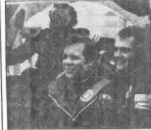
عکس: اورنوف کیهان نوردهان اتحاد شوروی و ولونکو کیهان نوردهان مغربی که در سال ۱۹۸۱ باهم پرواز کیهان کرده اند.