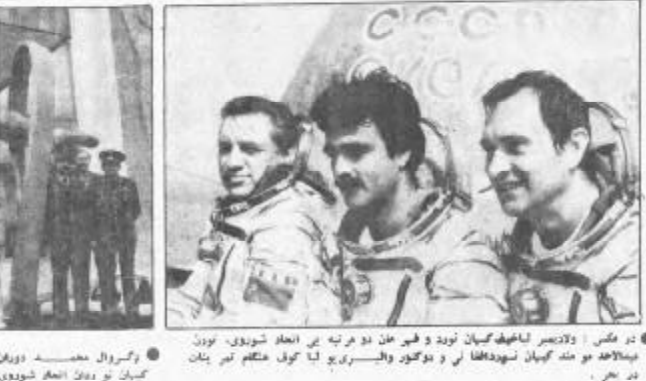
در مکتب اولادیسیر ایلیف کیهان نوردان و فیرمان دو مرتبه بر انعام شوروی. نوردان محمد توردان کیهان نوردان و دوکتور والیسریو لیا کول مکتب کیم پتان در بحر