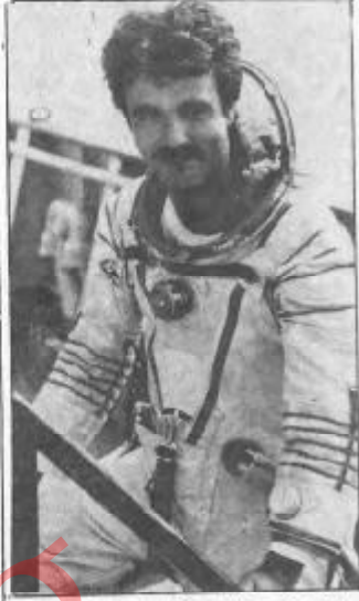
اورن میلاد در نخستین کیهان نوردهان اتحاد شوروی و مغربی که در سال ۱۹۸۱ پرواز کیهان کرده اند.