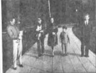
عکس: کیهان نوردهان اتحاد شوروی و مغربی که در سال ۱۹۸۱ پرواز مشترک کیهانی را انجام داده اند.