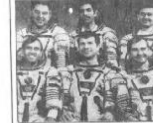
عکس: پرواز مشترک کیهان شوروی و مغربی که در سال ۱۹۸۱ انجام یافت تا اینکه مغربی را در فرجه هسته ای اقتصادی کشور اتحاد به پرواز آوردند.