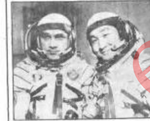
عکس: دو کیهانی پرواز کیهان مشترک کیهان نوردهان اتحاد شوروی و کوزیا که کیهان شوروی است.