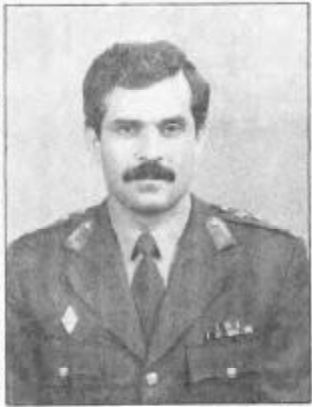
پرواز محمد توردان کیهان نوردان

مردم افغان نسلان اسرود تا خوشی برسوز. با ستار و سروند. با گزدهای هبا و سینک غایرگترین دستاورد کسور ما. انقلاب ما و منی صالحه علی راجین فیکرله. سور کال و دسار مراگن کسور برای بریا ساختن این چسین بزرگ امامد افغان. لا کاب و یوسر و ده ها و هزار ها چراغان این سنبله سنه است.