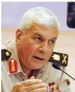
جنرال مختار الملا.

محمد حسین طنطاوی، رئیس شورای نظامی حاکم بر مصر از نخستین کسانی بود که ریاست جمهوری مرسی را به وی تبریک گفت. سرانجام رئیس جمهوری مصر طی مراسمی نظامی به طور رسمی قدرت را از شورای عالی نیروهای مسلح این کشور تحویل گرفت. مرسی، رئیس جمهوری مصر طی یک مراسم رسمی نظامی با حضور حسین طنطاوی، رئیس شورای عالی نیروهای مسلح مصر و سامی عنان، لوی درستیز این کشور و معاون طنطاوی و جمعی از فرماندهان عالی رتبه نظامی مصر قدرت را به طور رسمی از نظامیان این کشور تحویل گرفت. مرسی در این مراسم که با فیر گلوله توپ به افتخار وی آغاز شد در سخنانی عنوان داشت- امروز قدرت را از محمد حسین طنطاوی و برادران وی در شورای عالی نظامی مصر تحویل می گیرم و با قبول این امر مسئول شورای نظامی و تمامی ملت مصر خواهم بود. وی ادامه داد، شورای عالی نظامی مصر به وعده‌های خود در انتقال قدرت به رئیس جمهوری منتخب عمل کرده و امروز نقطه عطفی در تاریخ مصر خواهد بود.