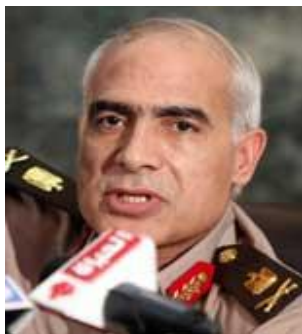
جنرال ممدوح شاهین

جنرال شاهین، مشاور حقوقی و قانونی اساسی شورای نظامی و نماینده اردو در مجمع فعلی قانون اساسی مصر است. پس از انحلال پارلمان مصر که بیشتر اعضای آن از گروه اسلامگرای اخوان المسلمین بودند، این مقام در کنفرانس تلویزیونی خود اعلام کرد که تمام اختیارات قانونگذاری را در ۱۴ جون ۲۰۱۲ بر عهده گرفته است و از سایر اقدامات اردو دفاع کرد. این مقام در ماه مه ۲۰۱۱ اعلام کرد که اردو باید نوعی تضمین دریافت کند که در صورت روی کار آمدن رئیس جمهوری جدید، این شورا تغییری نکند.