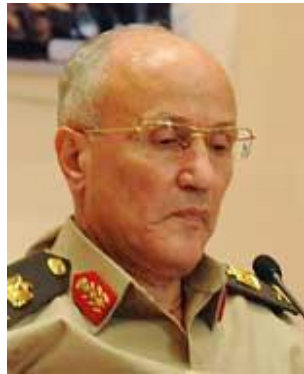
جنرال محمد العصار

این جنرال پس از انحلال پارلمان مصر در کنفرانس خبری خود با دفاع از اقدام اردو، گفت: ما قدرت کامل را به رئیس جمهوری کشور اعطا می کنیم. وی همچنین گفت که واگذاری قدرت طی مراسمی بزرگ در اواخر جون انجام خواهد شد. جنرال العصار همچنین چندین ماه پس از درگیری های مصر از سرنگونی مبارک به عنوان بزرگترین انقلاب در تاریخ مصر یاد کرد.