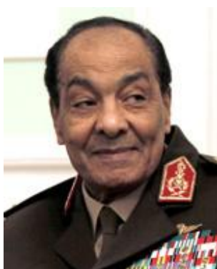
مارشال محمد حسین طنطاوی

این مقام در یازده فبروری سال ۲۰۱۱ به ریاست شورای عالی نیروهای مسلح مصر رسید و هم چنان سمت وزیر دفاع این کشور را نیز در اختیار داشت. روی کار آمدن وی پس از سقوط دولت حسنی مبارک، رئیس جمهوری سابق مصر بود. طنطاوی یکی از مهره های اصلی در رویداد های مصر پس از انقلاب ۲۵ جنوری ۲۰۱۱ است و نفوذ وی بیش از هر فرد دیگری قابل مشاهده است. طنطاوی در دوران مبارک برای مدت بیش از بیست سال یکی از متحدان مورد اعتماد وی بود. در یکی از اسناد دیپلماتیک فاش شده سفارت آمریکا در قاهره به واشنگتن در سال ۲۰۰۸، از طنطاوی به عنوان فردی جذاب و با وقار یاد شده است اما در واقع وی فردی سالخورده است که به شدت در مقابل تغییرات ایستادگی می کند. در این سند افشا شده همچنین آمده است که افسران سطح متوسط مصر به طنطاوی سگ پودل مبارک می گویند. این نوع سگ به ناکارآمدی، قدیمی بودن و وفاداری مشهور است.