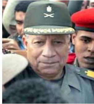
جنرال حسن الروینی

این جنرال مصری پس از استعفای حسنی مبارک، از طرف اردو مسئول محاکمه کردن ۷۰۰۰ تا ده هزار تن از انقلابیون مصر شد. اتحاد دموکراتیک که ائتلافی از احزاب سیاسی مصر است و در جریان انقلاب شکل گرفت، جنرال الروینی و سایر جنرال های اردوی مصر را به کشتار معترضان متهم کرد. یک روز پیش از استعفای مبارک، این جنرال مصری در جمع تظاهر کنندگان ضد دولتی میدان التحریر حضور یافت و گفت: تمام خواسته های شما برآورده می شود.