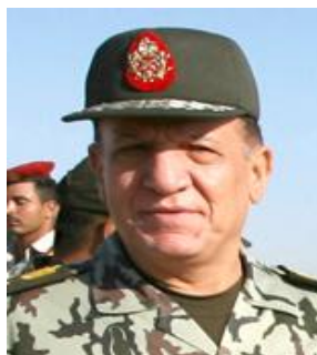
جنرال سامی حافظ عنان

این جنرال مصری همواره از گزینه های محبوب اردوی آمریکا بوده است و از وی به عنوان فرمانده دوم در میان جنرال های حاکم بر مصر یاد می شود. سامی حافظ عنان یکی از افسران سنتی اردوی مصر است که بر عملیات های اردو و نوسازی در ساختار اردو تمرکز دارد و در دولت آتی مصر نقش مهمی ایفا کرد. مقام های آمریکایی می گویند، جنرال عنان یکی از خطوط ارتباطی میان قاهره و واشنگتن محسوب می شود که نقش رابط را میان دو کشور ایفا می کند.