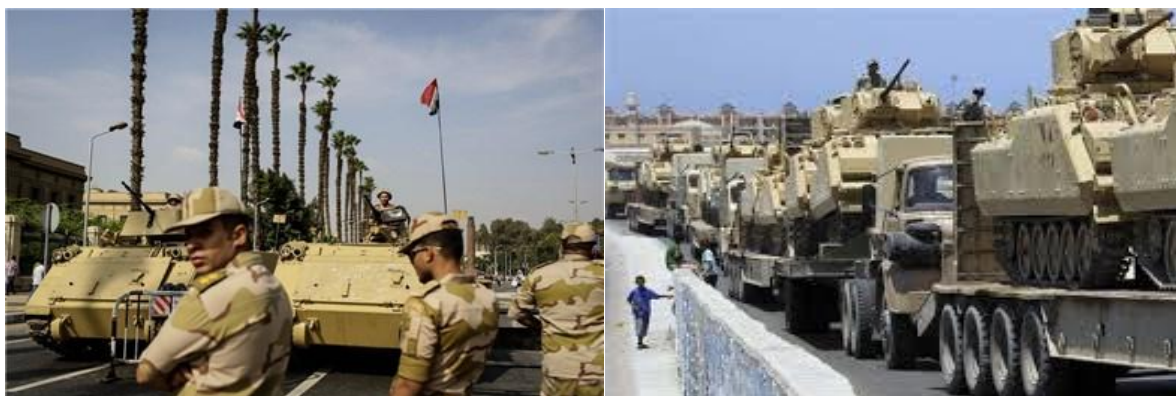
مارشال محمد حسین طنطاوی رییس شورای نظامی قبلی